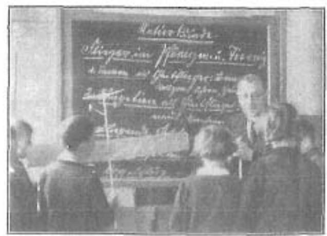
An Beispielen der Natur erläutert der Lehrer das Geheimnis des Fliegens. Fliegende Samen, Fische und Landtiere sind den kleinen Hirzenhainern vertraut.