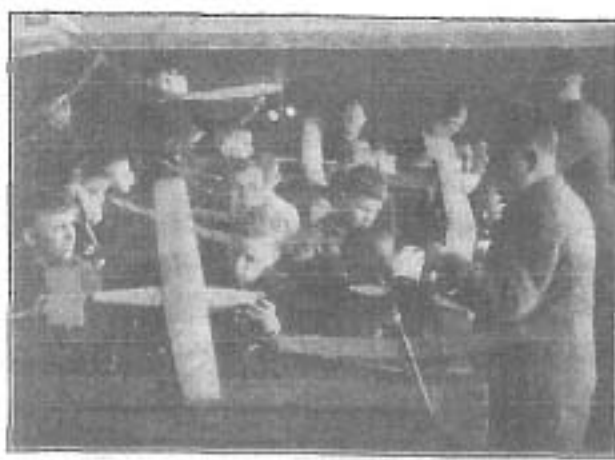
In der Hirzenhainer Dorfschule: Der Flugzeug-Modellbau ist ständiger Unterrichtsgegenstand geworden.